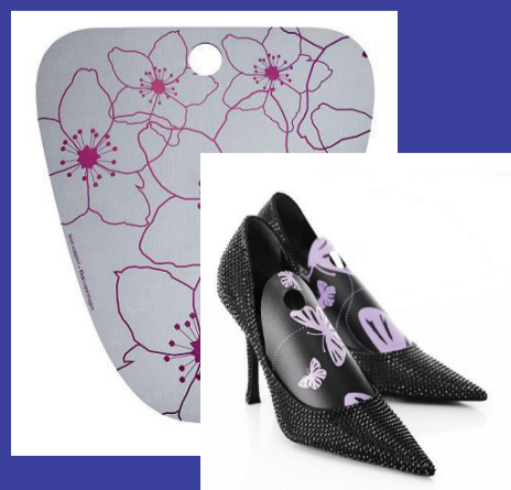
Ting til entreen. Boot og shoe support.