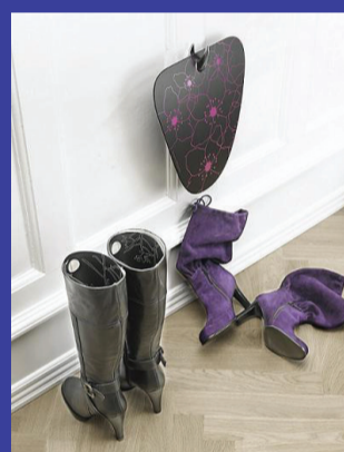
Ting til entreen. Bootsupport.