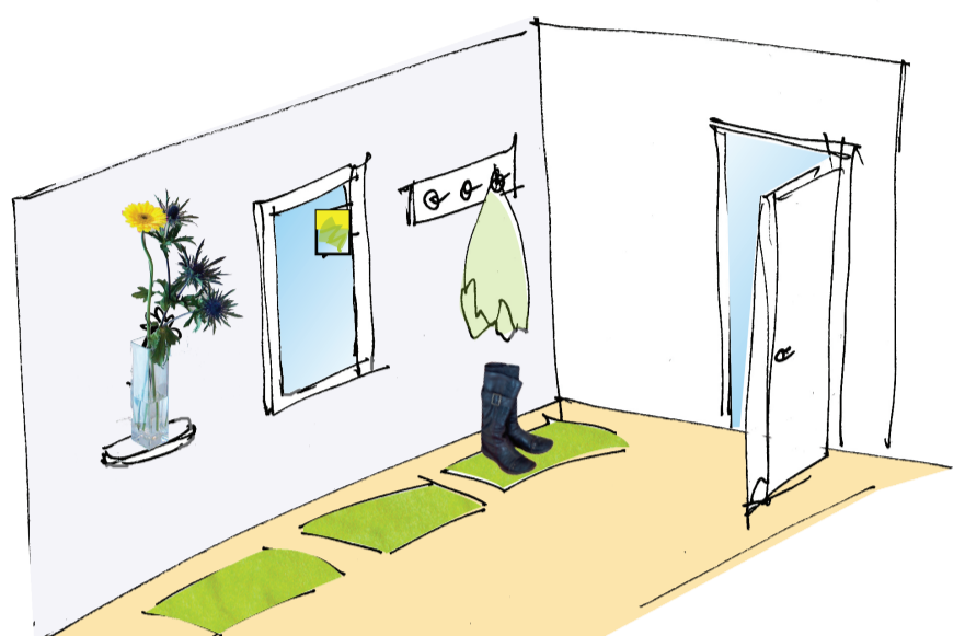
Køb en blomst eller to, og fin et sommer foto til spejlet.