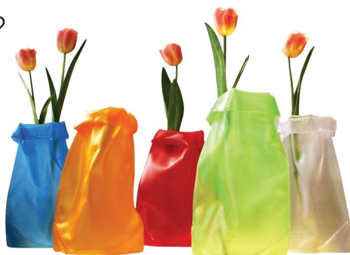
Le sack vase

Og bliv så siddende der indtil vintergækker og krokus titter frem og vi igen kan ane grønt på græsplænen. Rigtig god fornøjelse.