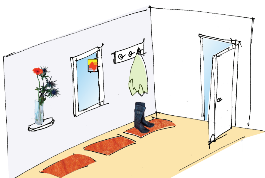
Sæt forår farver i entreen

Så har du altid et rent sæt i din entré, og samtidig har du fået lidt farver på. Køb et sæt blomster i matchende farve. For eksempel en orange gerbera - en blomst som minder en om forårssol. Sæt et sommer billede i kanten på spejlet i entreen - og du er så småt ved at vinde over vinteren.