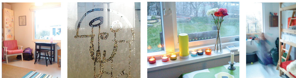
Masser af kludetæpper, morgendug og børnetegninger på ruden, stearinlys, kreative blomster og en endnu ikke malet køjeseng i 3 etager. Næppe noget der ville få plads i den "rigtige" bolig.

Når 165 m 2 med fuld kælder samt for- og baghave bliver til 40 m 2 alt inklusiv.