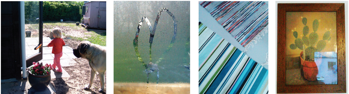
Terrassen før der kom græs omkring, flere dug tegninger, klude tæpper og loppefunds billede, hvor vores lyserøde togvogns skur spejler sig i.

Vores kolonihave er på 40m 2 . Indretningen er stort set - loppefund, Ikea praktisk og en hel del klude tæpper!!