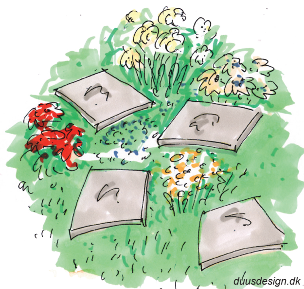
Garden stones fra 4HOUSE.dk

nips og andre ting, der fortæller en lille historie om lige vores familie. Som en sjov lille historie eller kommentar på "gulvet" i dit ude bad, kan man lave en flise med sine børns- eller måske hele familiens fodaftryk. De fine personlige fliser kan også bruges til en lille sti i rosenbedet eller på græsplænen - eller et andet sted i haven, hvor man har lyst til, at der skal fortælles en lille historie.